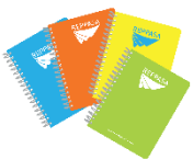
Planeador de clases

El docente debe presentar (cada periodo):